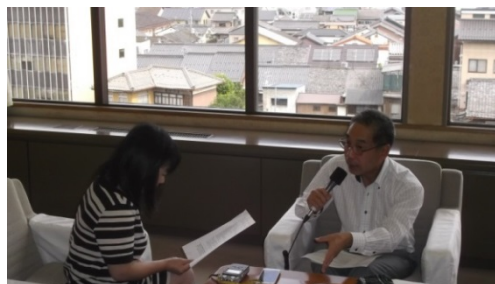
FM放送議長インタビュー（H27. 6. 30）