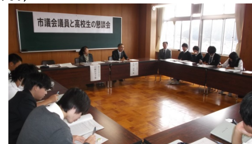
議長、議員と地元高校生との懇談会（H27. 10. 2）